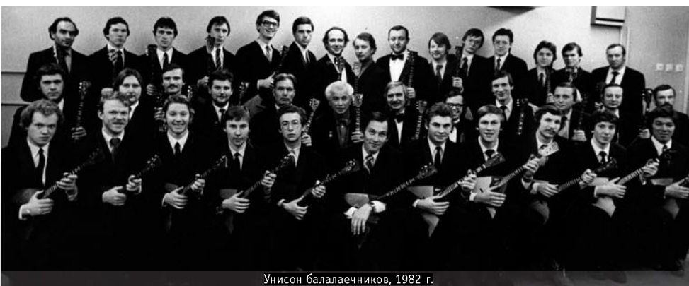
Унисон балалаечников, 1982 г.

К слову, и в этом направлении, Нечепоренко подтверждает свою универсальную незаурядность. Как бы мимоходом, по случаю, ради любопытства, экспериментируя буквально несколько раз в жизни, он создает несколько инструментальных шедевров. Кроме названных обработок, это, без преувеличения, знаменитые на весь мир Вариации на тему 24 каприса Паганини – энциклопедия технических, художественных возможностей инструмента, настольная книга для любого балалаечника, претендующего